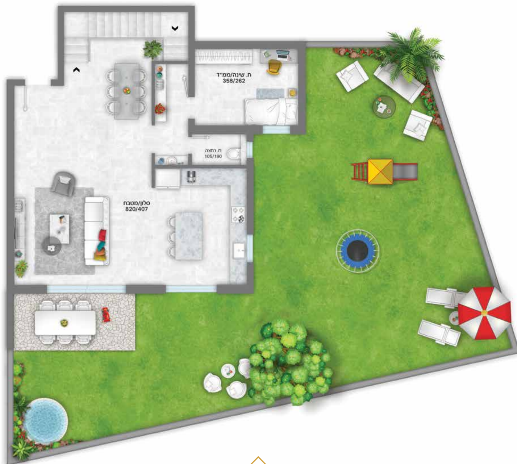
↑ קומת קרקע